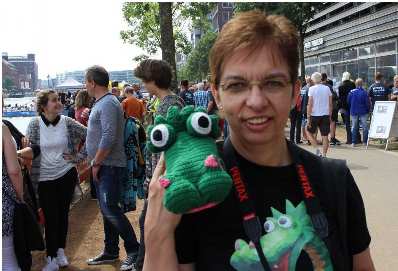
TEAM DNH - Duisburg Nessie Hunters - excel yet again at Duisburg Inner Harbour Dragon Boat Race on 11 June 2016. "It can only get better!", claimed an innocent bystander.